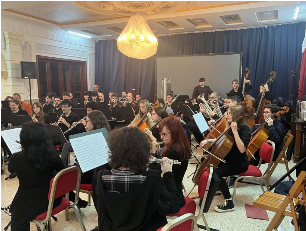
Концерт у Валети, на Малти (2024) у оквиру пројекта Ерасмус+

Школа одржава и развија сарадњу како са домаћим, тако и са страним, сродним, институцијама учешћем у међународним разменама и пројектима (Италија, Словенија, Пољска, Немачка, Шпанија, Малта).